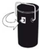
1 INSÉRER LA CANETTE